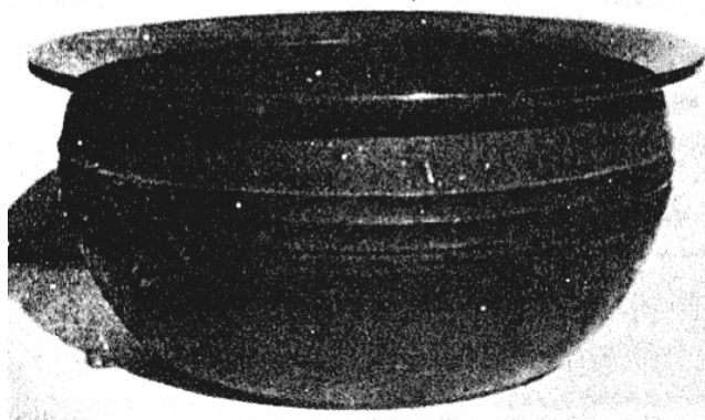
傳世陽嘉四年朱提銅洗